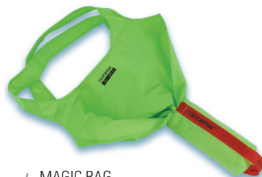
MAGIC BAG Espèce protégée Se déploie en période de shopping