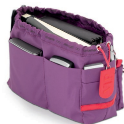
VERY INTELLIGENTE POCKET Espèce indépendante Migre d'un sac à l'autre en 5 secondes