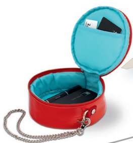
BOX Espèce émancipée Sort la nuit et fait la fête le jour