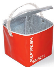
REFRESH POCKET Espèce Polaire Cohabite avec un cool pack qui passe ses nuits au congélateur