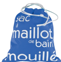
SWIMMING BAG Espèce aquatique Evite l'inondation au retour de baignade