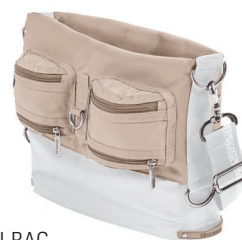
BI-BAG Espèce évolutive Se développe en fonction des espaces alentour